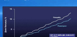
Развитие сердечной недостаточности в исследовании НОРЕ

Исследование «НОРЕ» продемонстрировало снижение суммарного риска сердечно–сосудистых осложнений. Лечение рамиприлом привело также к снижению сердечно–сосудистой смертности, риска инфаркта миокарда и риска инсульта. В исследовании выявлено снижение риска развития сердечной недостаточности, ревакуляризации и макро– и микрососудистых осложнений сахарного диабета.