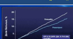
Комбинированная конечная точка в исследовании НОРЕ (сердечно-сосудистая смерть, инфаркт, инсульт)

В исследовании «НОРЕ» было включено 9451 большой группы высокого риск (средний возраст 55 лет). У них имелись признаки сосудистых заболеваний или сахарный диабет, а также, по крайней мере, 1 дополнительный фактор риска, но отсутствовали сердечная недостаточность или снижение фракции выброса левого желудочка. Пациентам назначали ингибитор АПФ рамиприл или плицебо . Длительность терапии составила в среднем 4,5 года, а первичной конечной точкой исследования была суммарная частота ИМ, инсульта и смерти от сердечно–сосудистых заболеваний.